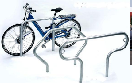
F.B - 3 modèles d'arceaux avec anneaux