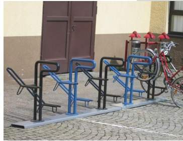
C - supports à 2 places sur râtelier de sol auto-stable

NORCOR VELO Les solutions professionnelles pour le garage des 2 roues Jean-Pierre GROULT CD 270, route de Manerbe 14 130 Coquainvilliers MOB. 06.88.42.44.74 TEL. 02.31.63.07.86