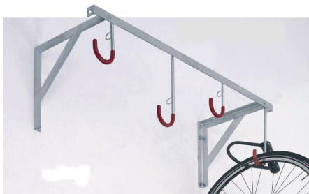
D - 3 à 8 crochets de suspension verticale

NORCOR VELO Les solutions professionnelles pour le garage des 2 roues Jean-Pierre GROULT CD 270, route de Manerbe 14 130 Coquainvilliers MOB. 06.88.42.44.74 TEL. 02.31.63.07.86