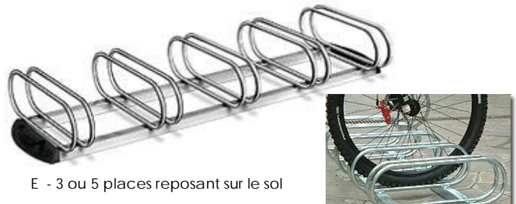
E - 3 ou 5 places reposant sur le sol