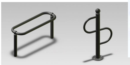
G - Modèles urbains pour motos ou vélos