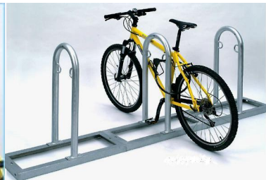
F.A - Modules extensibles d'arceaux avec anneaux d'attache, sur râtelier