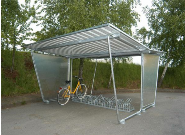
A - Abri-vélos économique double-face