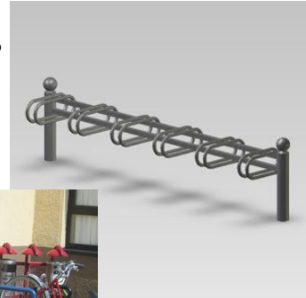
B - Sur poteaux latéraux décoratifs simple face (6 places) ou double face