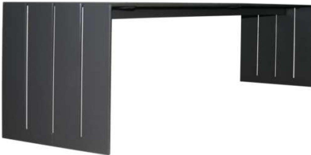
Banc d'extérieur STEEL BLOC 4 places