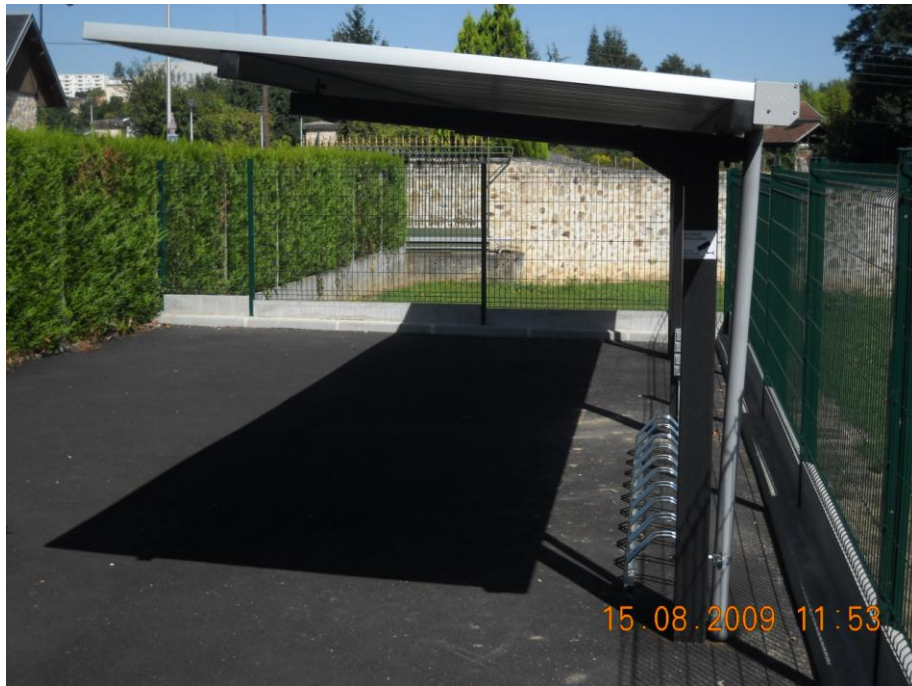
option gouttière + tuyau descente EP