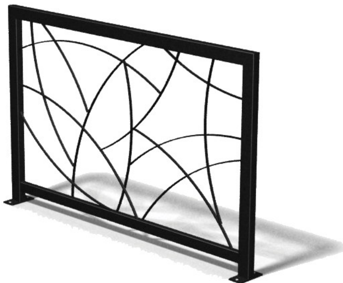
Barrière de ville T - LAUTREC en acier.

- 3 longueurs disponibles LN 1060, 1560 et 2060 mm