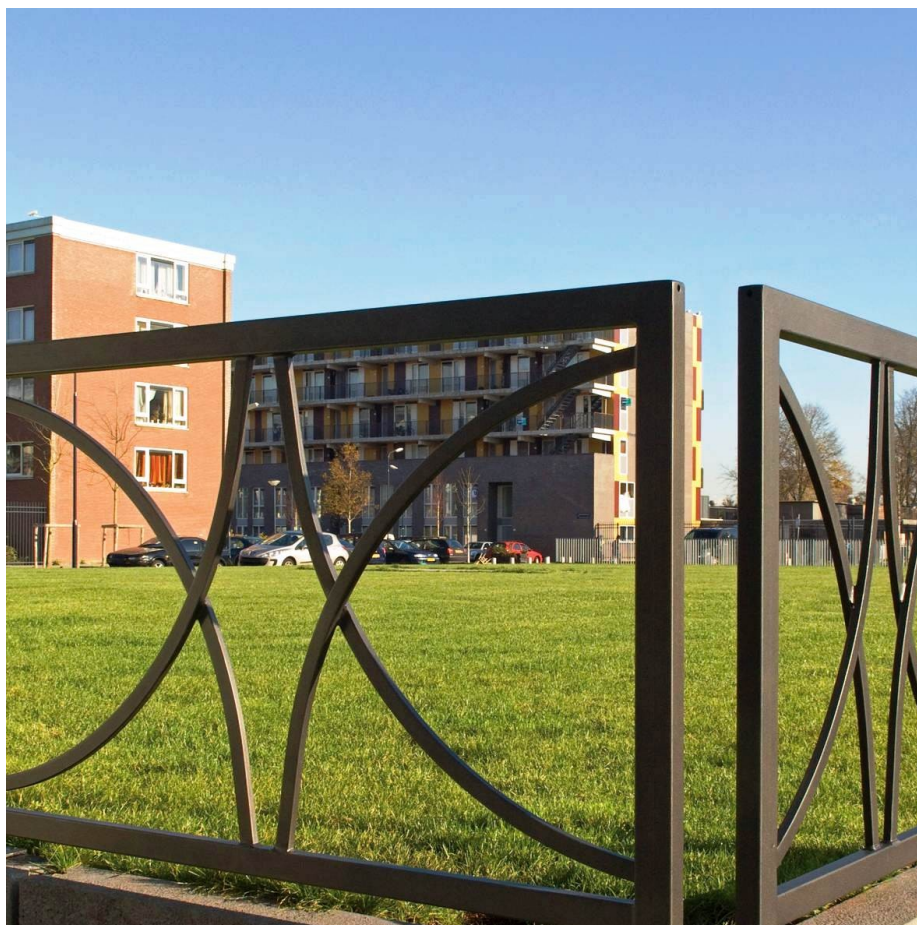
Barrière de ville T - LAUTREC en acier.

- 3 longueurs disponibles LN 1060, 1560 et 2060 mm