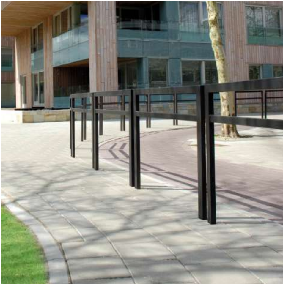
Barrière de ville LINEAR en acier.