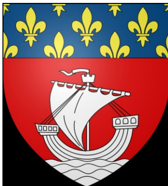
Modèle utiisé à Paris