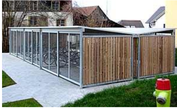
Modèle au design actuel, toit type pente droite légère en V