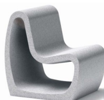
(chaise largeur 600 mm coordonnée)